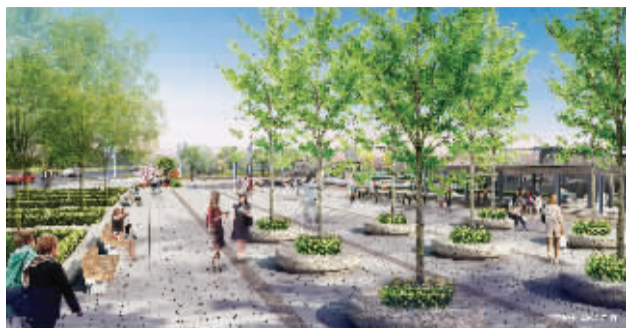
滨水中心广场效果图