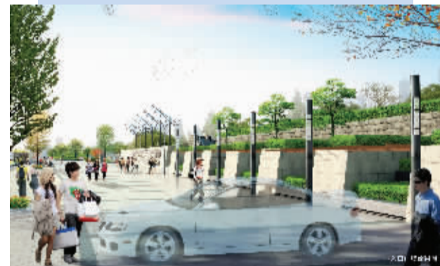
主入口广场效果图