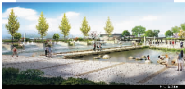
滨水中心广场效果图