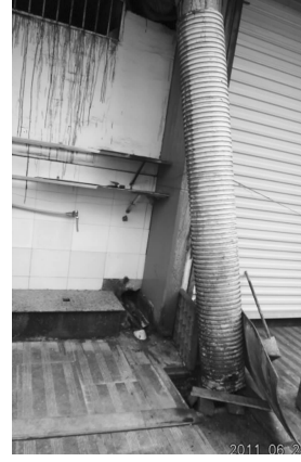
东联菜场周边一小店如此排烟