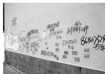
电力公司附近墙弄乱涂写