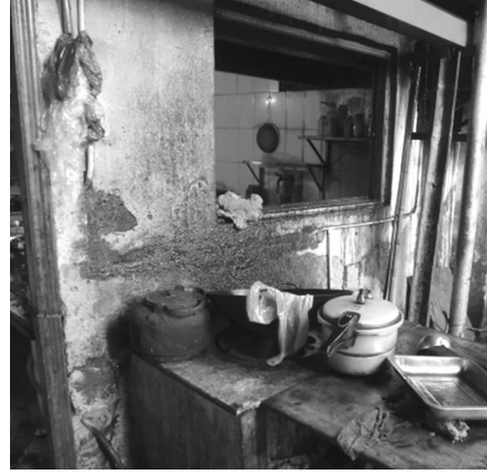
墙壁已经熏得黑乎乎、油腻腻