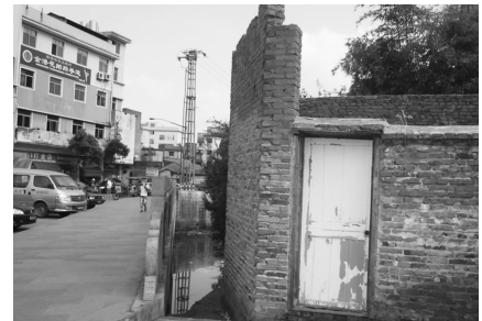
东联菜场斜对面乱搭建