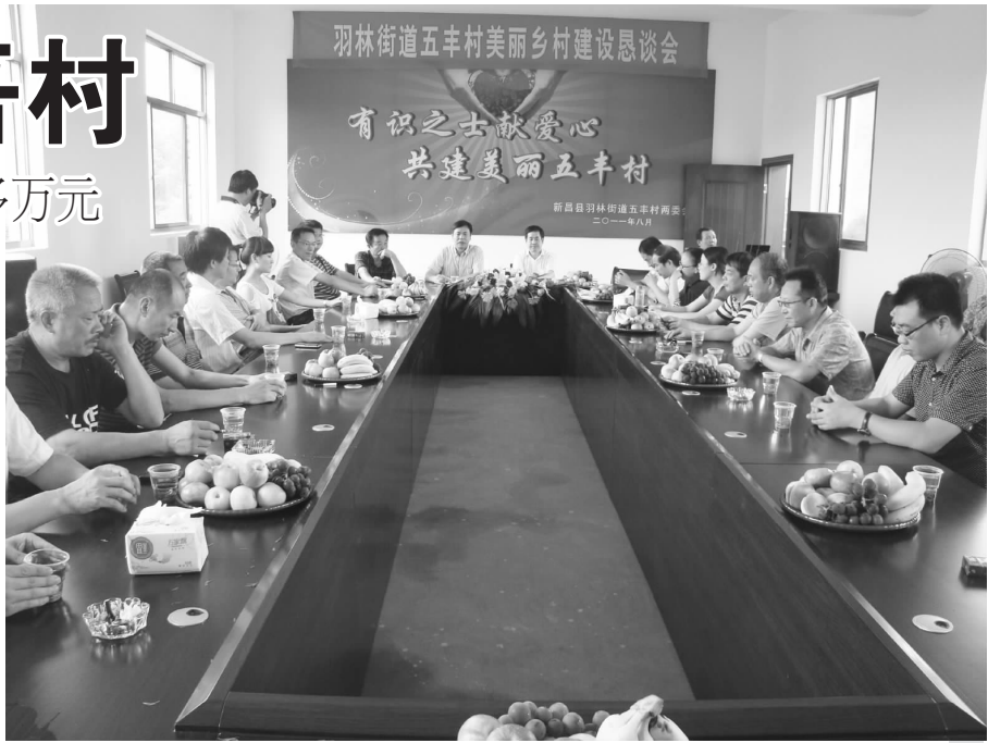
羽林街道五丰村美丽乡村建设恳谈会