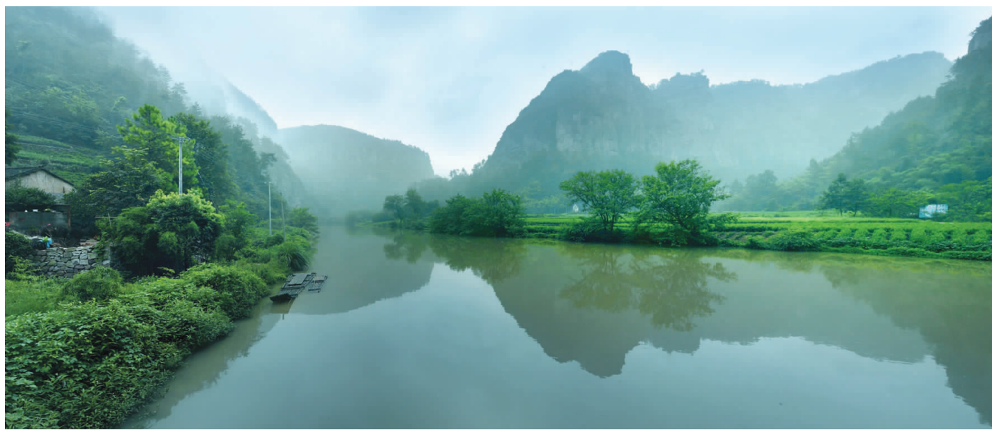
诗意山水