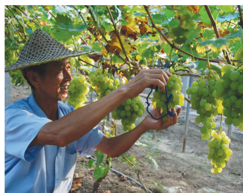
硕果累累