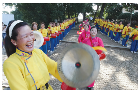
古道幸福锣