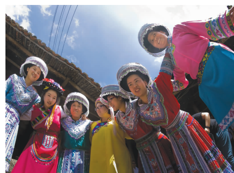
外婆坑民族风情