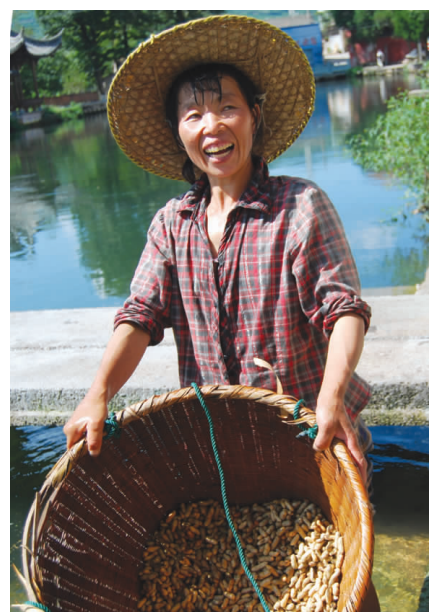
丰收小京生