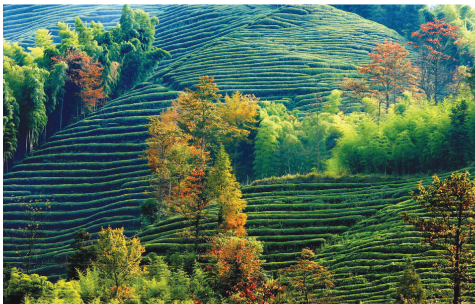
茶乡秋色