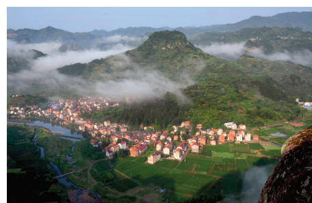
穿岩人家