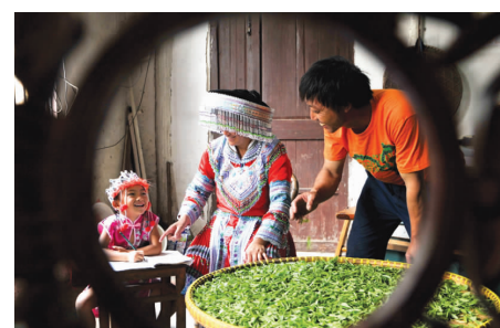
采茶归来