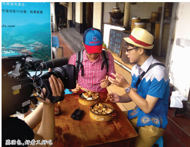
蒸汤包,好看又好吃