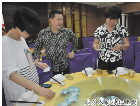
服务人员持证上岗

高考期间,佛城大酒店推掉旅游团队部分餐饮业务,专门设置了宽敞的考生就餐区,为来自农村的高考考生做好餐饮服务。为保证考生高考期间饮食安全,佛城大酒店专门成立了11位厨师和服务员组成的高考接待服务组,从制度上、软硬件能力上做好服务工作,受到县有关部门和学校的好评。