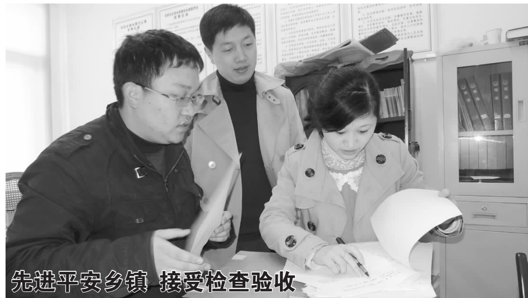
先进平安乡镇 接受检查验收

近日,市平安(综治)办组织人员,对我县申报2012年度市级先进平安乡镇的双彩乡、小将镇,进行实地检查验收。图为检查人员正在双彩乡检查台账资料。