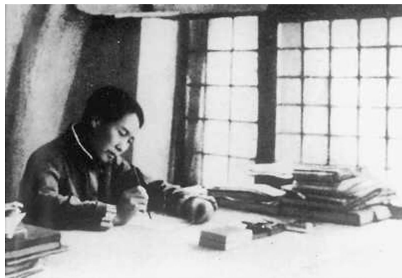
1938年,毛泽东在延安窑洞内撰写《论持久战》。