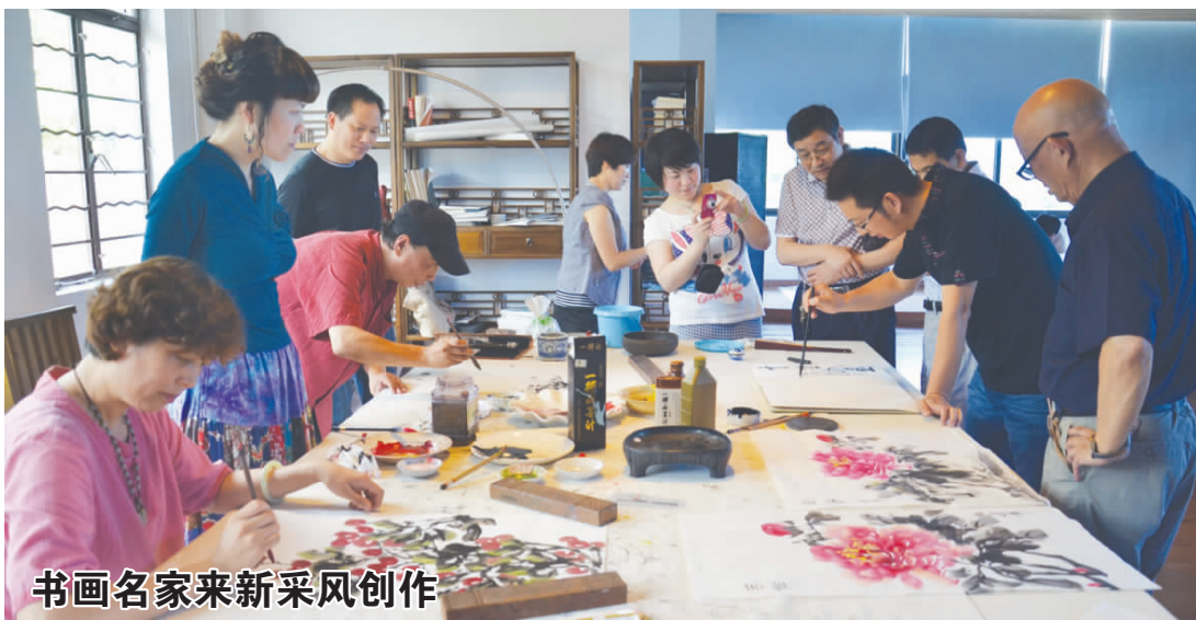
书画名家来新采风创作

检查组对我县“六五”普法中期工作开展情况给予较高评价,并就进一步推进“六五”普法工作提出意见和建议,希望我县进一步提高思想认识,做好查漏补缺工作,弘扬典型经验,进一步整合力量,探索老百姓喜闻乐见的普法载体,形成大普法的格局。