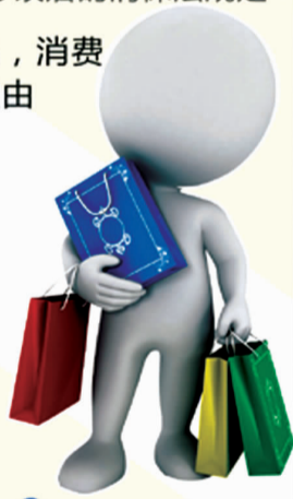
新华社记者 胥晓璇 编制