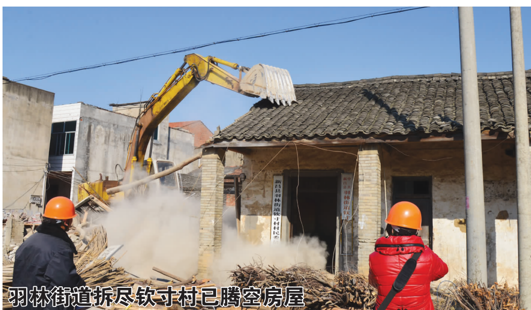
羽林街道拆尽钦寸村已腾空房屋

汇报会上,工商、农业、卫生、城管等相关部门负责人就各自职责,做好人感染H7N9禽流感疫情防控工作进行了汇报、交流。