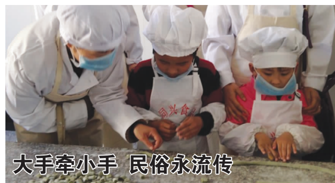
大手牵小手 民俗永流传 3 月 22 日，县青少年活动中心举办“妈妈，我们做清明果去”亲子民俗体验活动。家长和孩子一同走进同兴食品有限公司生产车间，参观并亲手制作清明果，加深了对传统节日“清明”的了解。（通讯员 陈秋风 张卓媛 摄）

为做好清理工作，大家明确分工，对每个楼道进行地毯式大清扫，并对旧抽水马桶、废旧木板和破损砖头等杂物进行分类清理。在清理过程中，遇到个别不理解的居民，大家就耐心地劝导，宣传文明健康的生活习惯，力求还社区居民一个安全干净顺畅的居住环境。（通讯员 杨晓英）