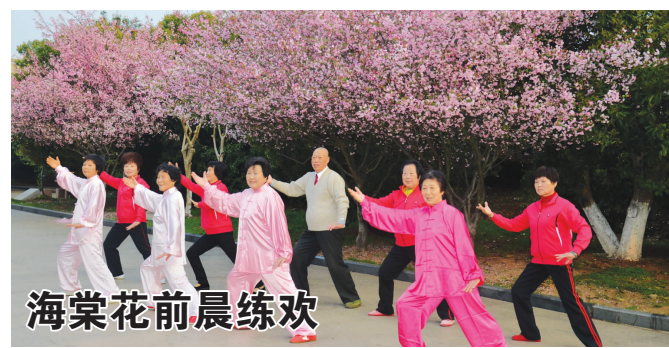
海棠花前晨练欢 滨江公园建成以来，因其优美的环境，宽阔的场地，完善的设施，一直是广大市民喜爱的去处。图为我县市民在公园的海棠花前晨练。