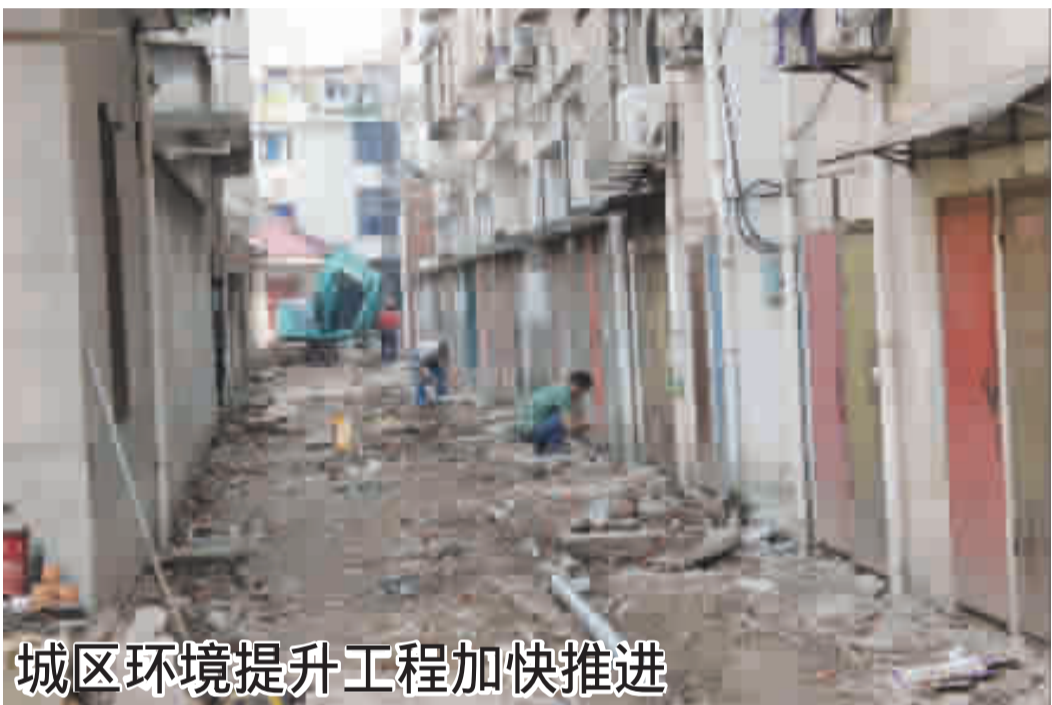
城区环境提升工程加快推进

“三馆”建成后,将集开放性、文化性、多功能、现代化于一体,更好地传承新昌丰富的历史地域特色文化,并与鼓山公园遥相呼应,成为新昌的标志性文化建筑和市民文化休闲的胜地、爱国主义教育的示范基地。(通讯员 徐兰兰)