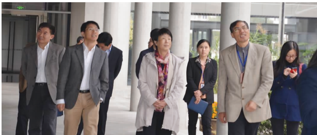
省财政厅党组副书记、省地税局常务副局长到新调研,走访企业。

五、落实措施,提高服务水平。 一是优化服务设施。在办税大厅安装排队叫号系统,完善视觉识别系统,优化办税大厅服务环境;深化办税服务厅规范化建设,推行自助办税服务系统,提升办税服务厅综合服务功能。二是完善便民举措。利用“12366”服务平台,向纳税人发送短信提醒服务;依托纳税服务志愿者、纳税人之家等服务载体,引入第三方资源和社会中介机构,开展软件技术服务外包工作;发挥《税友龙版》办税服务模块功能,深化涉税事项网上办理功能,开展“提速增效”服务;落实权力清单制度,成立新昌县行政服务中心地税分中心,增加财税窗口及办税大厅工作事项,积极推动行政审批制度改革。三是健全服务制度。扩大免填单范围,开展限时办结服务、涉税事项办结提醒服务,开通午间办事绿色通道,完善夏季错时上下班、“点单式”上门服务等个性化服务。