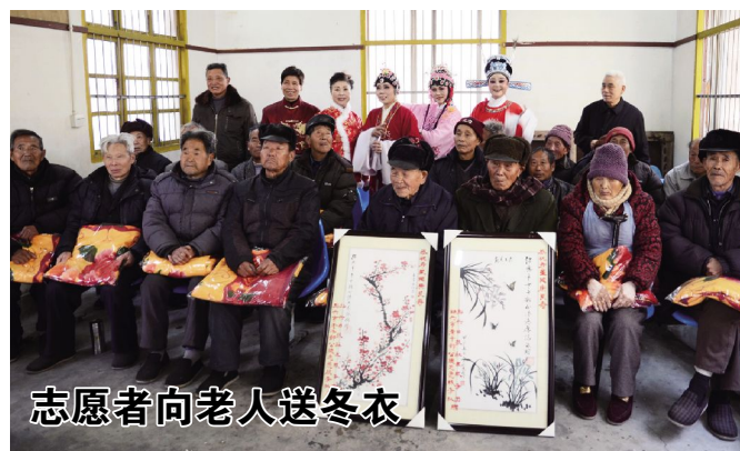
志愿者向老人送冬衣

新昌新闻记者俞信婷摄影报道 12月26日，由绍兴日报社区服务团、绍兴老干部公德志愿服务队以及新昌爱心联盟、新昌青年之力组成的志愿者团队走进沙溪福利院，为老人们送去冬衣、鞋帽和毛毯，还献上了一场精彩的戏曲表演，让老人们倍感温暖。