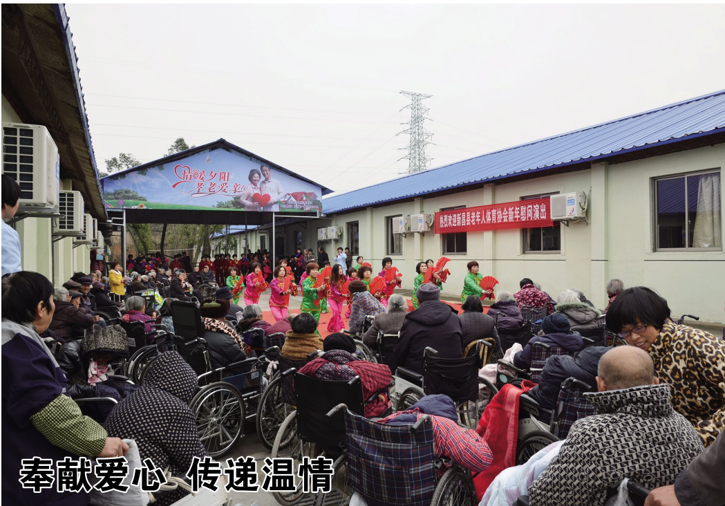
奉献爱心 传递温情

12月28日上午，县老年体育协会组织慰问团到夕阳红养老院进行新年慰问演出。演出人员以饱满的激情表演了精彩的节目，给老人们献上了浓浓的爱意与丰富的精神食粮。