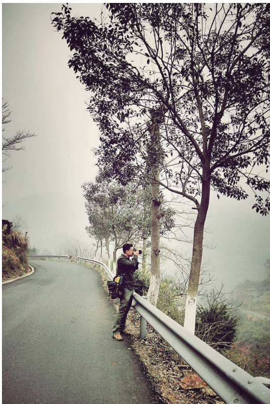
俞汀说,庄园里的花草给人带来美,摄影则是记录美,他不是美丽的花草,所以他只愿给记者一个正在记录美的侧影。