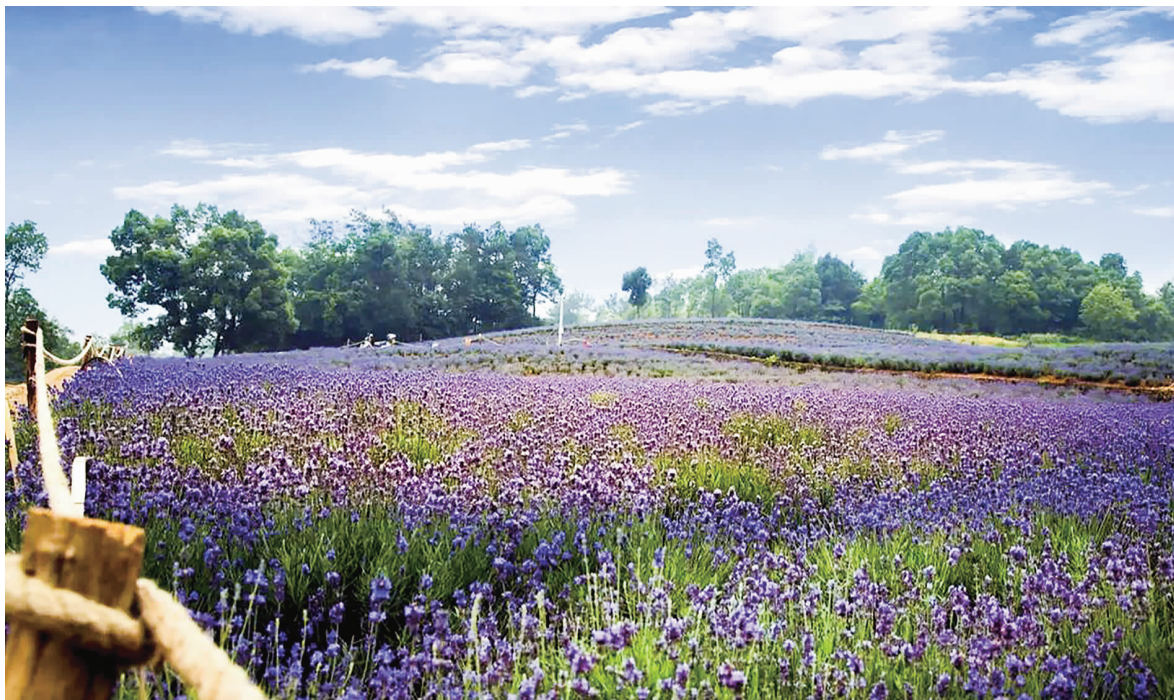
生态园内曾经盛开的薰衣草