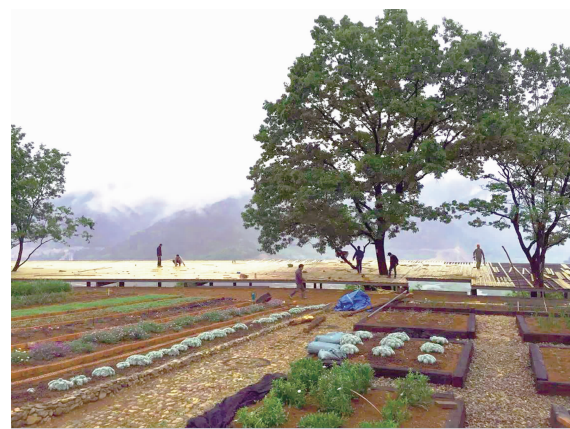
即将完工的观景台