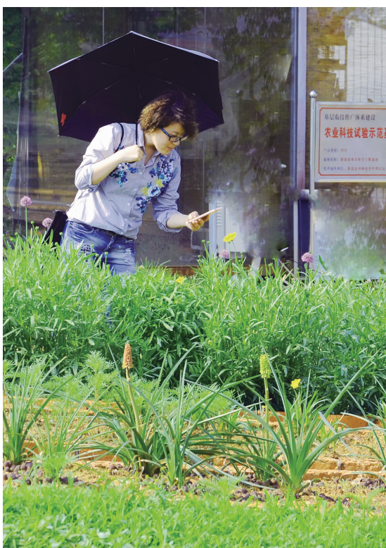
生态园还未正式开园,已有市民前来寻花。