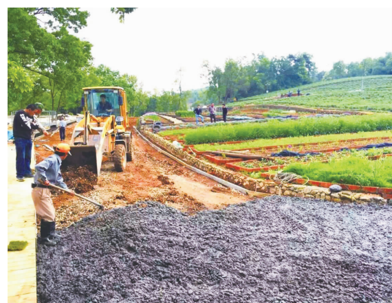
路面硬化正在施工

据说,放一小袋干掉了的薰衣草在身上,可以让你找到梦中情人。待“草农·生态园”内的薰衣草开遍,你又会怎样美丽的邂逅呢?