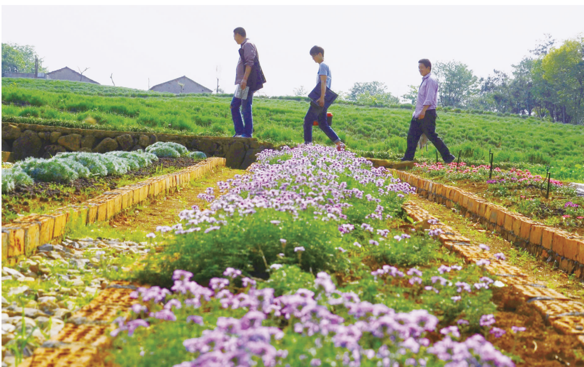
薰衣草还未盛开,已有美丽伫立在你脚边。