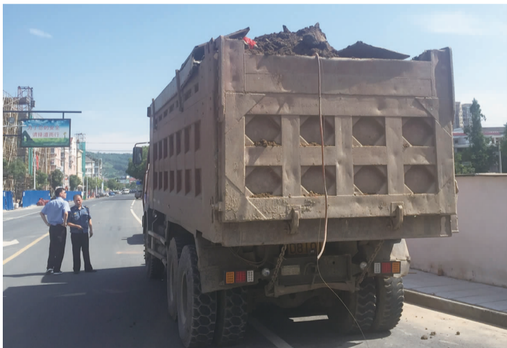
6月22日,浙DD8101工程运输车因超载被交警扣6分,罚款200元。