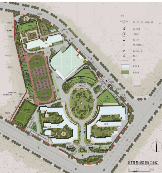
总平面图(新昌县技工学校)