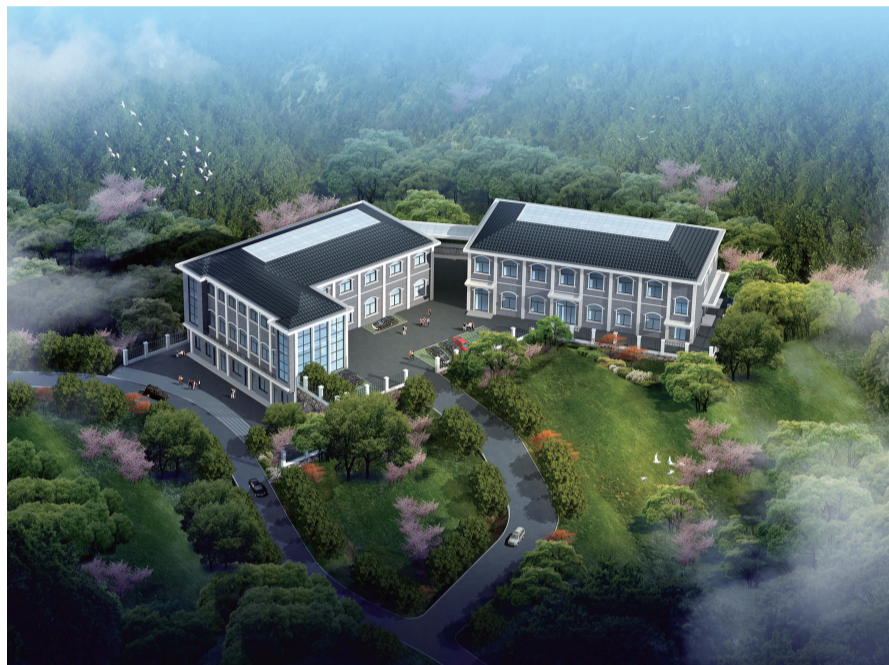
新昌县小将林场生态公益林管护中心建设工程总平面图 1:250