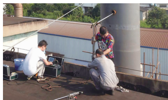
沙溪某铸造厂楼顶, 环境监测站工作人员在庞大的冲天炉边, 现场采集炉内废气进行监测。