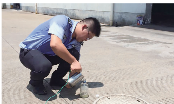
沿江东路某轴承厂内, 环境监察大队工作人员打开雨水窨井盖进行水样采集检查, 汗水已经打湿整个后背。