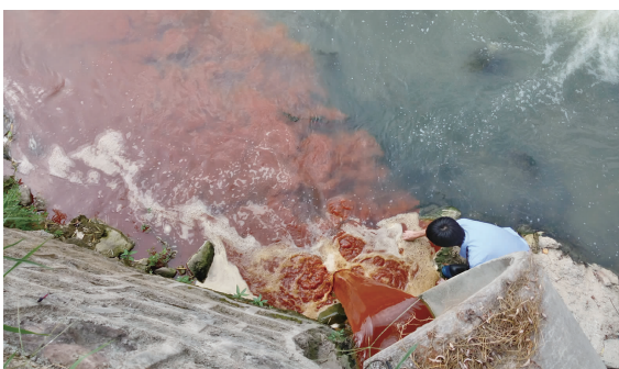
某企业排出大量被添加剂染红的回收水, 环境监察大队工作人员第一时间奔赴现场。