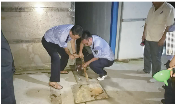
闷热的夜间, 环保工作人员合力撬开某企业厂区内的一处雨水窨井盖, 进行水样采集检查。

致敬这些为保护生态环境挥汗如雨的环保卫士! 也致敬为蓝天白云奉献一己之力的你们!