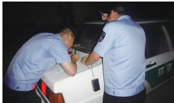
某企业不正常运行水污染物处理设施, 澄潭环保所工作人员夜间赶赴现场进行查封。