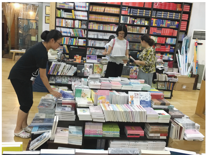
新昌新闻网记者 高娃

暑期已经接近尾声,即将迎来的返校、入学潮,再次加温“开学经济”。近日,记者走访城区部分商场、书店、文具店、数码产品店发现,各类学习用品多以“开学季”打折、购买赠礼的方式吸引了顾客,“开学经济”逐渐升温,不少学生和家長在选购的同时增添了一丝理性。