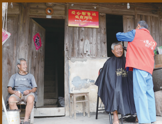
老年人乐享爱心服务