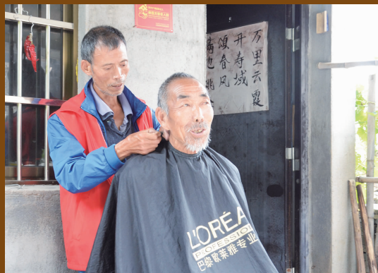
为村民提供上门服务