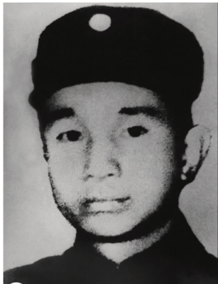
1 红军挺进师师长 粟裕