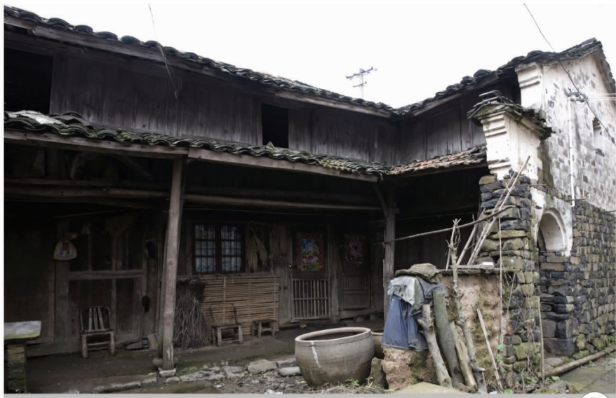
上下西岭村下西岭自然村红军挺进师过境住宿地