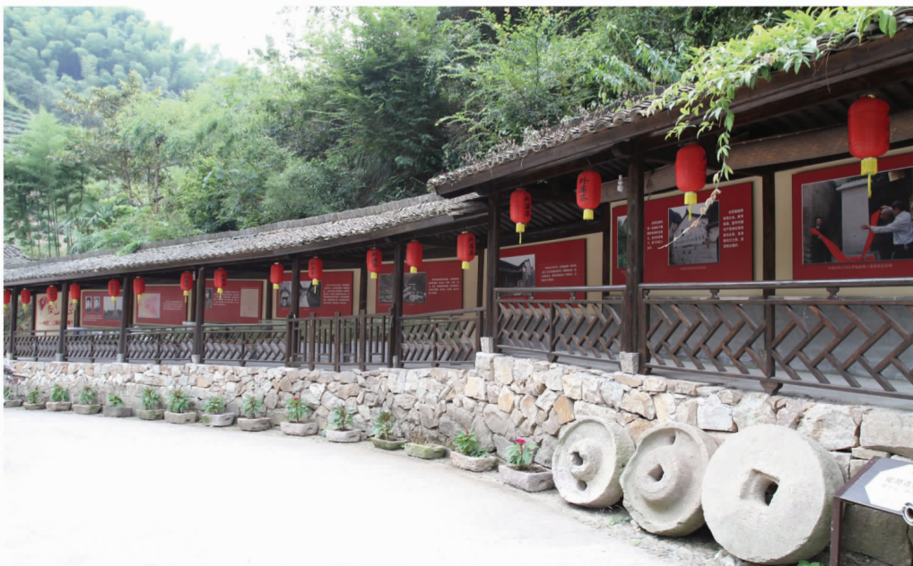
外婆坑村《红色足迹——中国工农红军挺进师在新昌》红色长廊