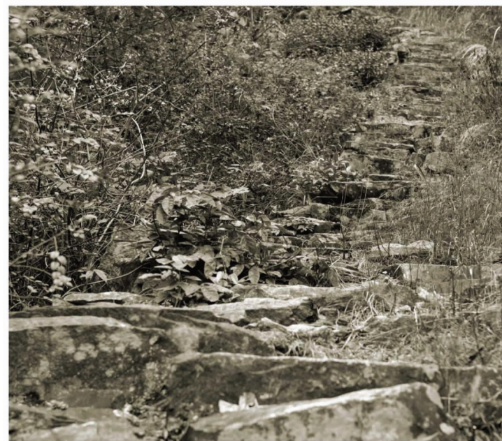
4 外婆坑村红军挺进师走过的小路