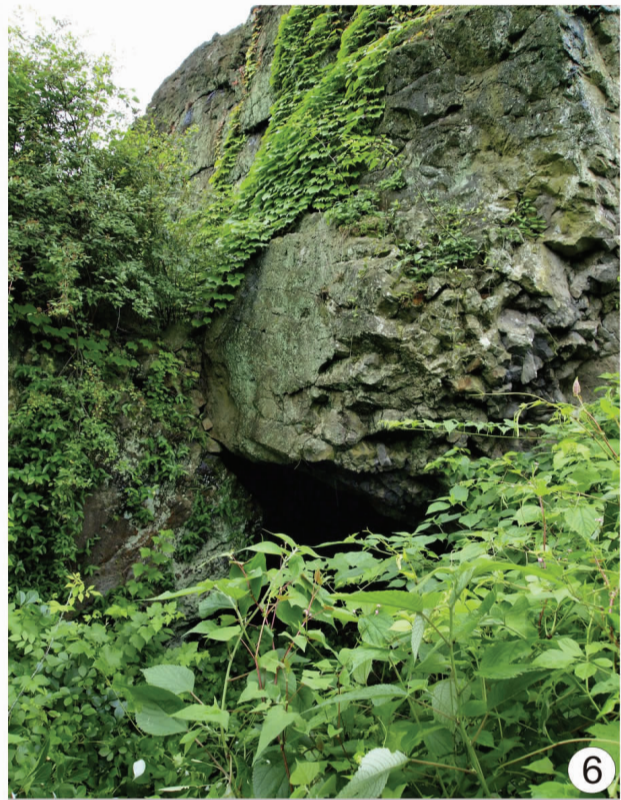
荷花塘村红军挺进师战士疗伤时曾住的山洞