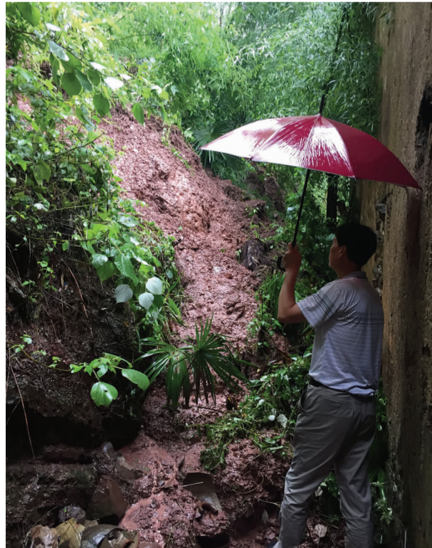
地质灾害巡查常态化确保民众安全