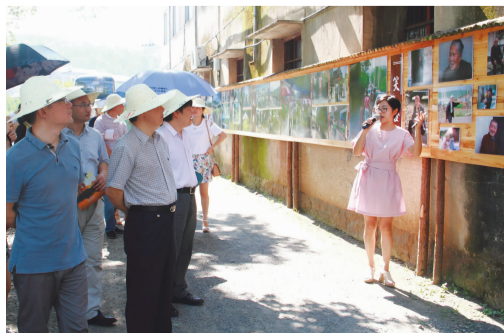
农村土地民主管理试点经验得到全市推广

提升素质抓效能,队伍形象更彰显。注重学习教育,积极开展“两学一做”教育;完善考核,建立实施干部健康档案管理制度;加强党风廉政建设,切实增强干部队伍廉洁从政意识,扎实开展风险源头防控,推进常态化作风行风建设,全力提升基层站所服务效能。