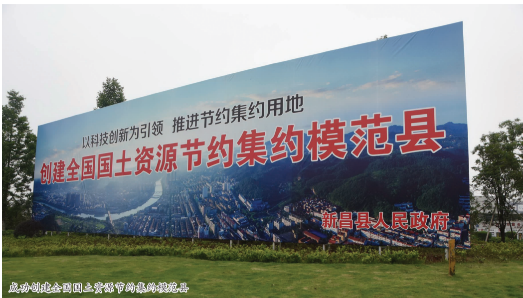
成功创建全国国土资源节约集约模范县