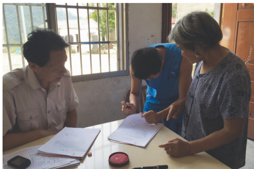
上门办证方便困难群众