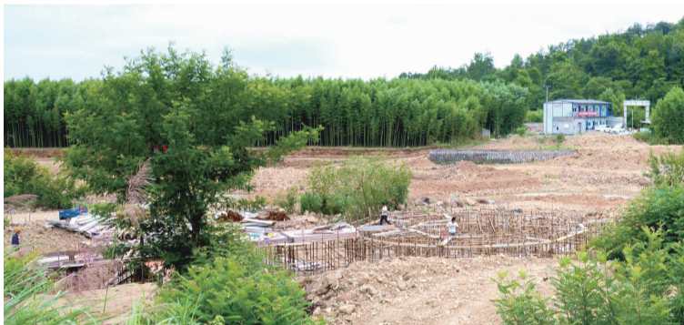
栈道临流施工现场