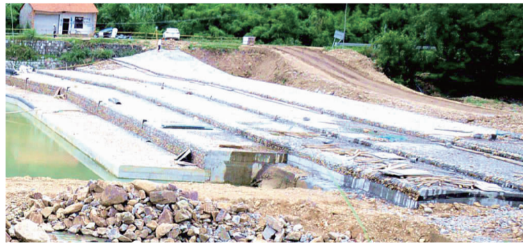
戏水叠堰施工现场