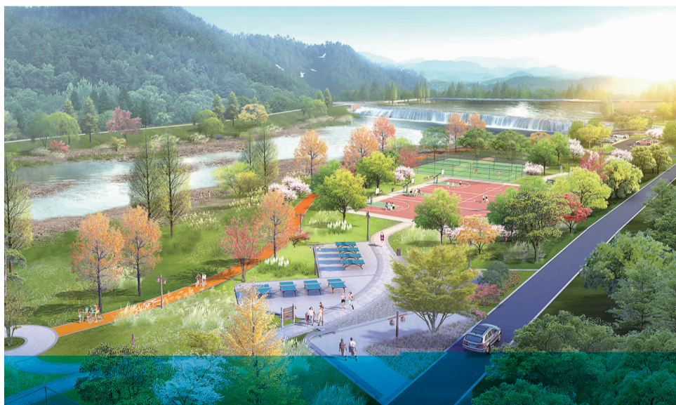
休闲运动场效果图