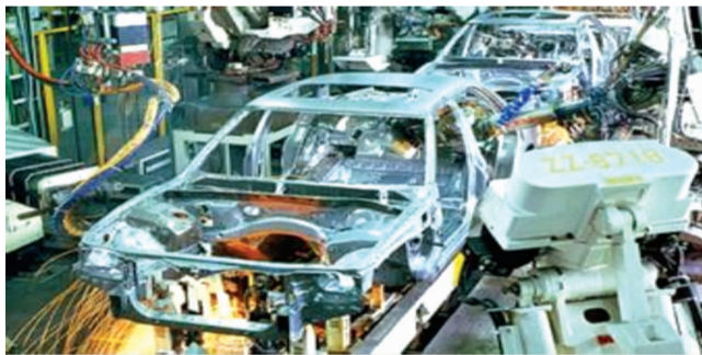
交通运输智能装备