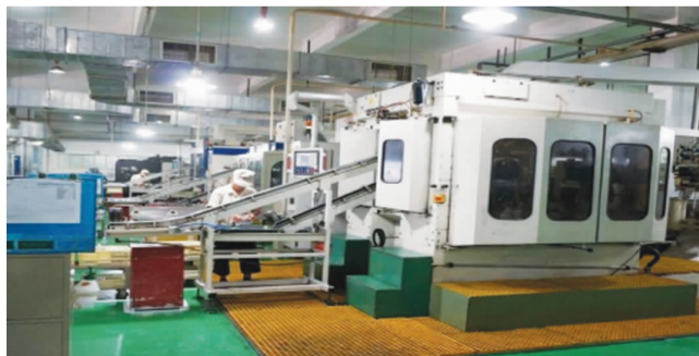
制冷环保智能装备