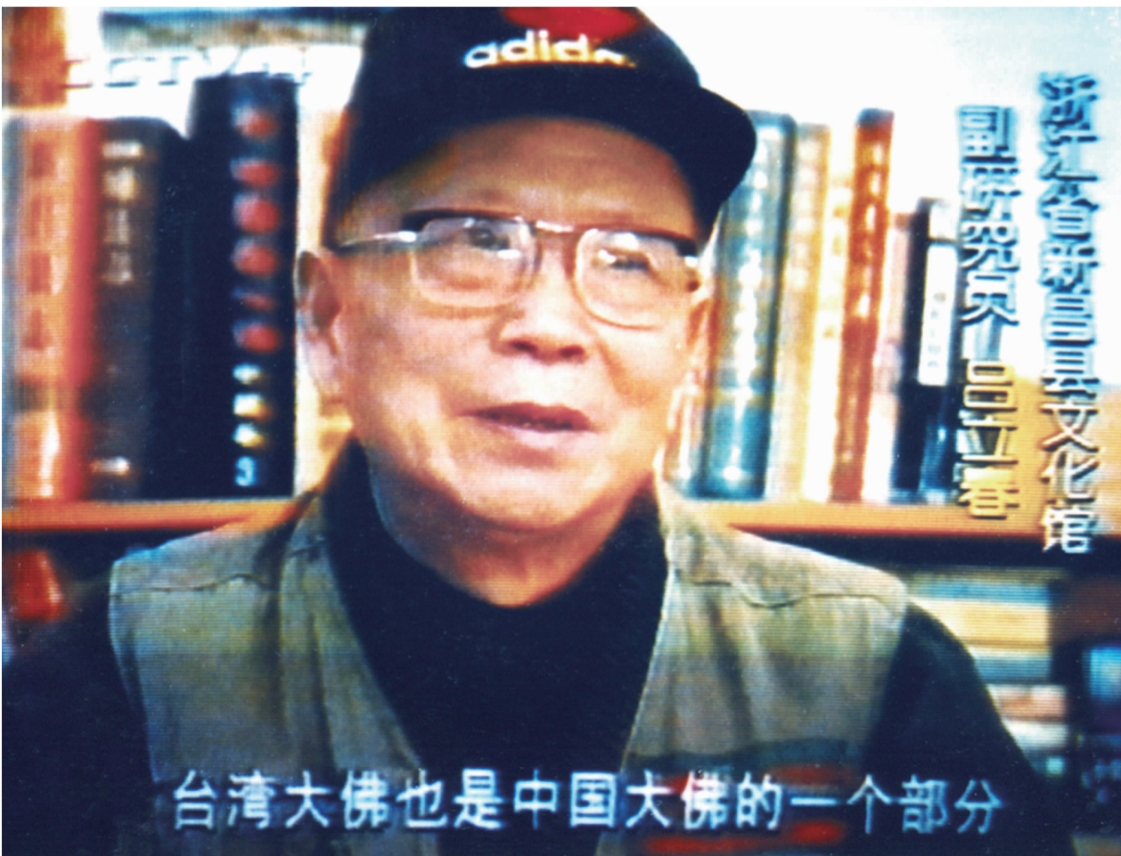
面对央视记者,作者动情地说:“台湾大佛也是中国大佛的一个部分。”(央视截屏)