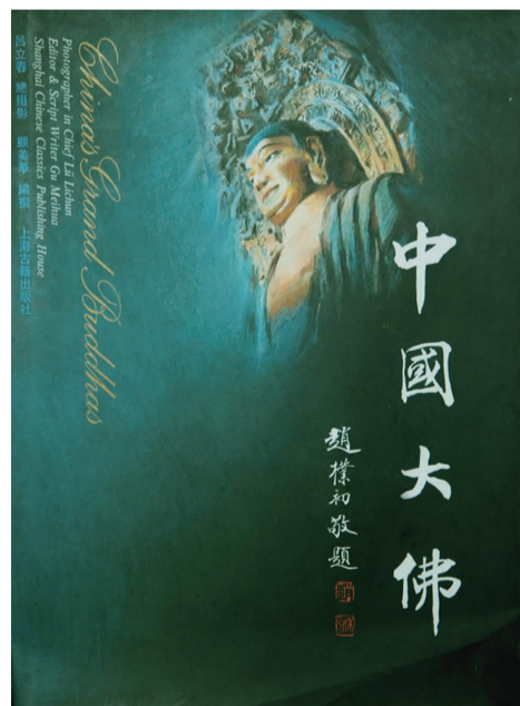
三度出版《中国大佛》