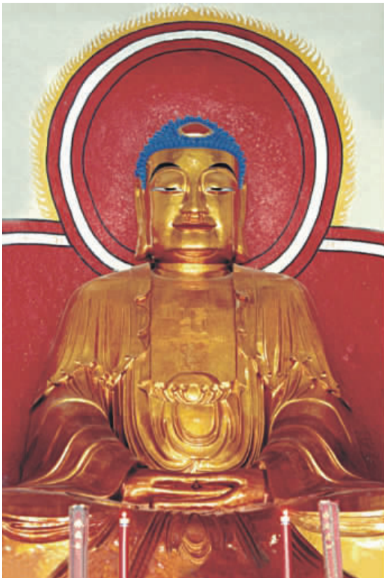
新昌大佛启领我们拍摄中国大佛