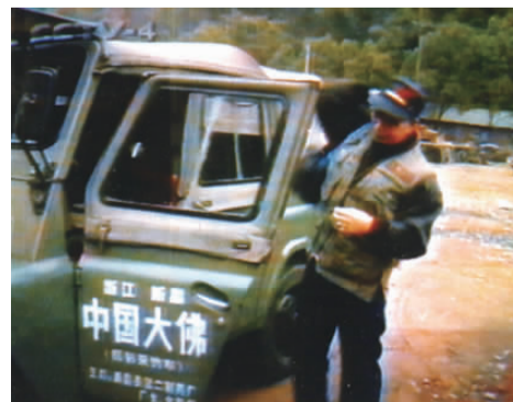
跑遍全国拍大佛