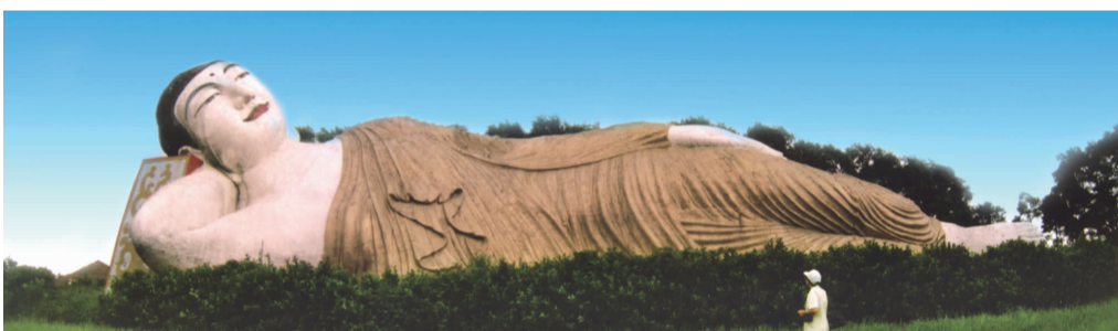
台湾六福大卧佛(台湾共有13米以上大佛5座)