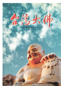
中国大佛系列