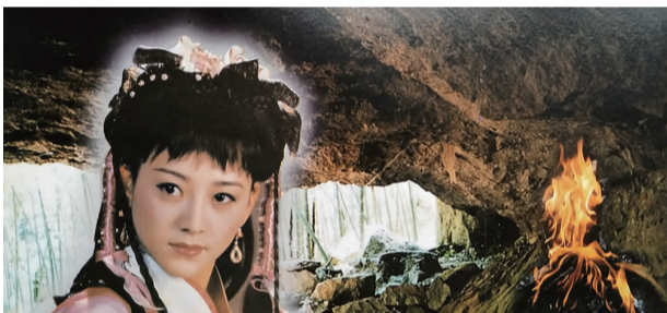
十九峰下影视拍摄地

在2013年的一次全县文艺界联欢会上,一台由网名“神山侠影(郭志贵)”编写的相声剧《今天的照片》,指的就是这十九峰景区照,剧中写道(选段),甲:这下山城可热闹了,真没想到,一张照片有这样大的吸引力。乙:当年张纪中(央视剧组制片人),在绍兴东湖,指着一张山水照片问:这个地方在哪里?甲:是新昌呀!乙:没错,就是新昌十九峰,据说是老一辈摄影家吕立春拍的。甲:张纪中通过照片开始向往新昌的山山水水了。乙:2000年,三四百号央视剧组浩浩荡荡的进驻新昌……今特选辑这组昔日景区照片,与读者共享。