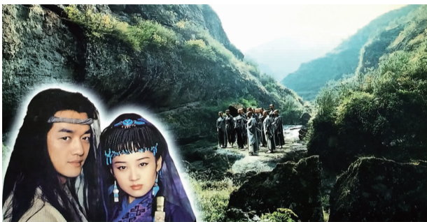
十九峰下影视拍摄地