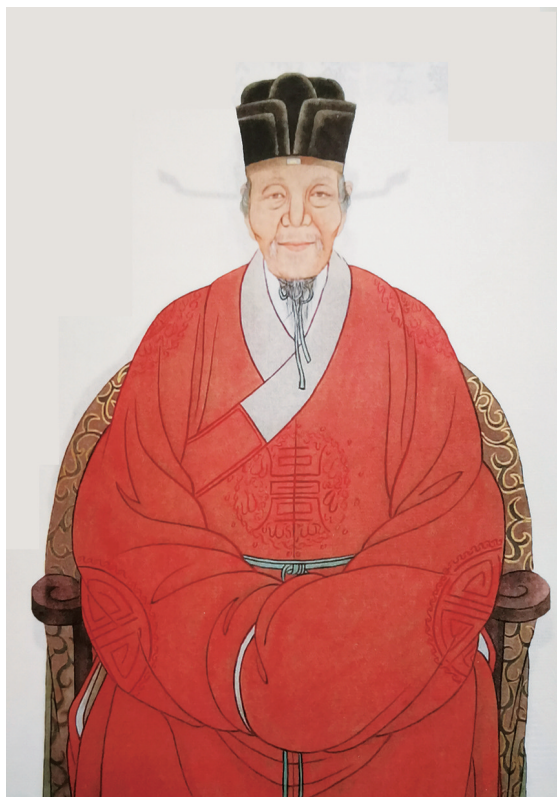
彩烟丁氏始祖丁振卿

彩烟丁氏,始祖丁振卿,唐僖宗(874-888)时避黄巢兵乱从山阴天章寺(今绍兴)迁居彩烟墓塘园(今回山大园),后裔分居于大坂(原称大田)、柘前、马坞头、汤家、里屋、王家塘、安山等地;有第十七世祖讳昭祖公,迁居天台,创赤山派,衍有子孙1.5万人,居平镇、屯桥附近16个村居,为台邑第四大姓。总祠为大园永思堂。十九世祖丁公讳绪,字新仲,号大堂,宋端平初任新昌县令。二十五世祖丁公讳川,字大容,进士出身,官至左金都御史,成化十二年,代天(皇帝)郊祭,故民间有“丁川代皇”之说。墓葬山头里丁都堂山,回山大园立有“代天郊祭”牌坊。