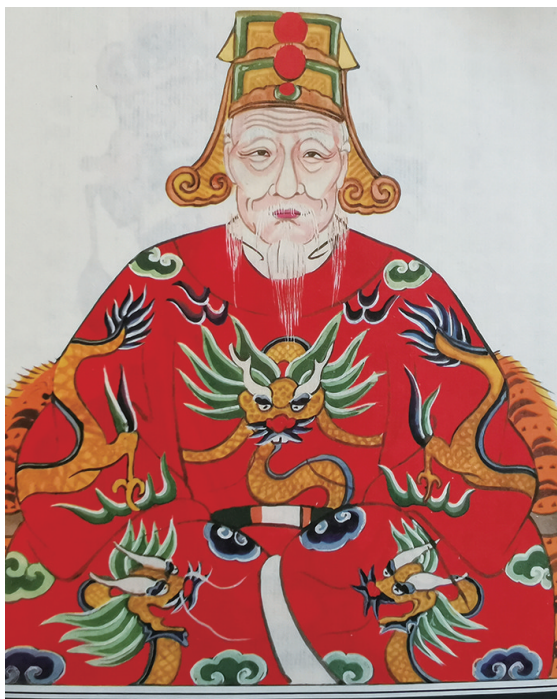
南洲丁氏始祖丁崇仁

“先有南洲丁,后有新昌城”。南洲丁氏是最早迁入新昌境内的四大姓氏之一。始祖丁崇仁(104-174),字乐道,山东济阳人,汉安三年(144)任刻县令。三年后,为避党祸隐居刻东南洲(今属新昌小将镇)。其族遂称“南洲丁氏”,后裔分居莒根、竹潭、茅洋、大岭下、丁家坞、竹岸等地。南洲丁氏自崇仁公隐居南洲,至今逾1800余年,传世已近七十代。总祠为南洲燕翼堂。南洲丁氏宗谱纂修较早,九世祖安丰刺史敬明公始修宗谱于晋咸甯元年。现宗谱有《南洲丁氏宗谱》《丁氏宗谱(莒根)》《丁氏宗谱(竹潭)》《新邑丁氏宗谱(茅洋)》《丁氏宗谱(琅珂)》《许宅丁氏宗谱》。