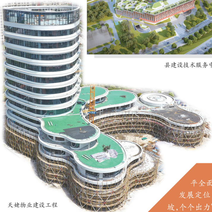
天姥物业建设工程

耕耘更知韶光贵,不待扬鞭自奋蹄。今年是建党100周年,也是“十四五”开局起步、高水平全面建设现代化新征程的第一年,县城投集团将紧紧围绕县委县政府各项决策部署,切实找准发展定位,把握发展机遇,大力弘扬“三牛”精神,唯实惟先、善作善成,全体城投入将凝聚起“九牛爬坡,个个出力”的奋斗合力,不负春光、辛勤耕耘,在奋力奔跑中书写高质量发展的更“牛”新篇章。