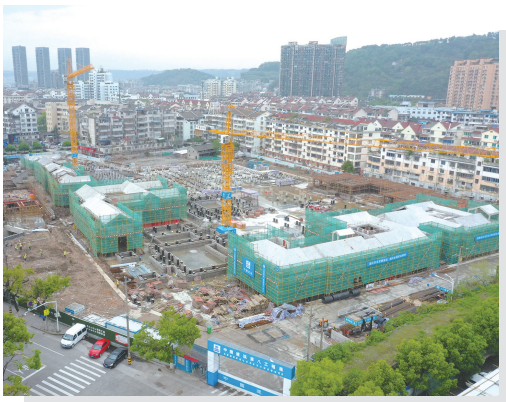
里江北历史文化街区建设项目