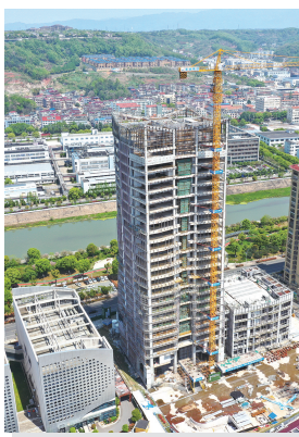
建业大厦建设项目