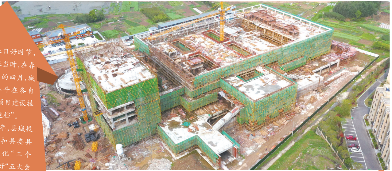
县农副产品交易物流中心建设项目

今年,县城投集团紧扣县委县政府深化“三个年”,打好“五大会战”总体要求,深入贯彻“起跑即冲刺,开春即攻坚”理念,紧盯总体目标任务,倒排计划,狠抓落实,干出快节奏,跑出加速度,全力推进项目建设,奋力实现全年红。