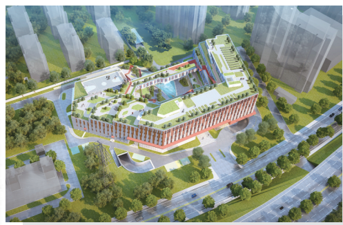
县建设技术服务中心项目