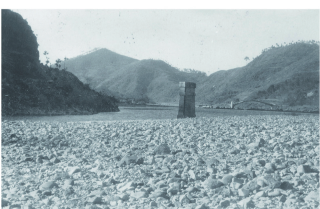
1942年新昌沦陷后遭破坏殆尽的兰沿铁桥一角。