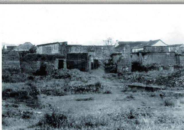
1941年遭日军飞机轰炸后的新昌县城一角。