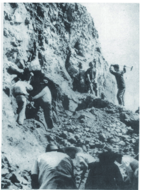
日军侵占新昌后,矿工在日军刺刀威逼下来掘矿石。