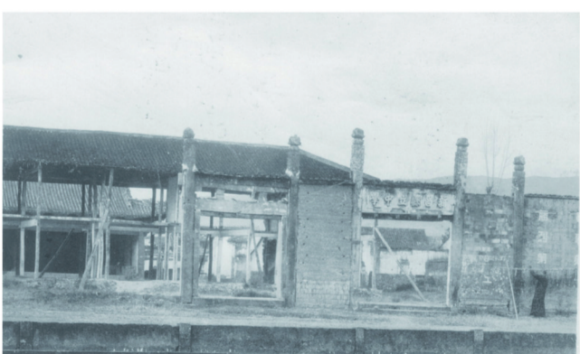
1942年新昌沦陷后遭破坏的新昌县立中学一角。