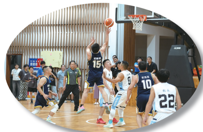
旅“澄”愉快棠村系列主题活动