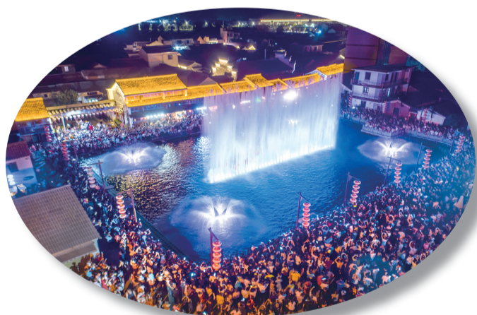
梅渚古村水幕电影