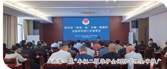
“两客一危”车辆二级维护全闭环管理全市推广

通过推动数据互联、深化闭环监管、强化动态预警等措施,构建“两客一危”车辆二级维护全闭环管理体系,提升我县交通运输行业安全水平。目前,已完成全省机动车维修行业监管服务改革示范试点工作,并实现全市推广。通过搭建一个平台,统筹一支队伍,建立一套制度,持续深化“浙路通”综合巡查工作省级试点成果,实现公路综合巡查一次的目标。截至目前,已累计巡查里程约21万公里,巡查发现问题782个,整改率达100%;同时,对偏远山区公路(约61公里)开展高精度无人机巡查工作,有效维护路产路权,保障群众安全出行。