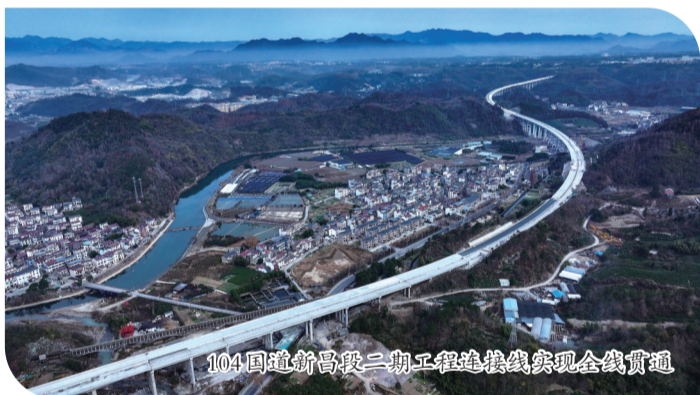
104国道新昌段二期工程连接线实现全线贯通

104国道新昌段二期工程起于南明街道莊前村,终于新昌、天台交界处关岭隧道洞口,主线长约21.31公里;连接线起点位于小石佛北侧接主线,终点接527国道,连接长约3.93公里,设两处互通。项目均采用双向四车道一级公路标准,设计速度80公里/小时,路基宽度24.5米,总投资约41.36亿元。截至目前,项目连接线已实现全线贯通,累计已完成投资额29.4亿元,总体形象进度达80%,计划2026年完工。今年,该项目获得2025年度超长长期国债资金1.1亿元。建成通车后,不仅能够带动沿线乡镇的发展,还将极大改善新昌至天台的通车条件,成为绍兴连接台州的重要“大动脉”。