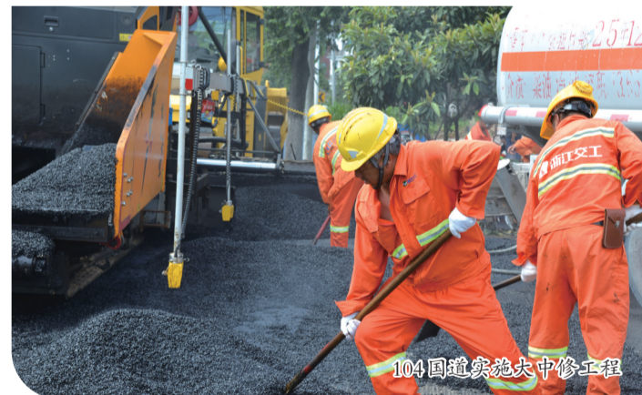
104国道实施大中修工程

重抓在建工程安全监管,开展汛期重大风险隐患排查、公路隧道专项检查、改扩建和跨线施工安全专项检查等行动,切实履行行业监管职责,加大监督检查力度,落实隐患排查整改;累计开展各类检查55次,发现安全隐患83处,下发检查意见33份。重抓公路品质提升工程,高质量完成农村公路新建、大中修等项目,保障公路安全、畅通;累计完成农村公路新建7公里、改造提升15公里,国道、农村公路大中修124.4公里。重抓公路违法专项整治,开展甬绍“两地五县”治超联合突击行动、打击“百吨王”等严重超限运输行为专项行动,已累计查处各类案件1448件。