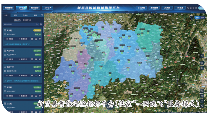
新昌县智能巡查指挥平台(低空“一网统飞”服务模式)

今年以来,县交通运输局锚定“强链筑基、生态赋能、场景驱动”路径,构建“产业链—生态链—价值链”三链协同发展体系,致力于打造“低空经济省域第一县”。在夯实“产业链”基础方面,依托万丰航空小镇等产业园区,已集聚低空相关企业25家,年产业规模突破42亿元,入选省级未来产业先导区培育名单。在构建“生态链”支撑方面,已建成直升机停机坪11个、公共无人机起降场1个、万丰机场改扩建工程有序推进;无人机自动化机槽63个、流动工作站10个,形成“居民区3分钟、林区6分钟”空中响应圈,搭建巡查指挥及管理服务平台,完成三维建模和AI识别算法开发,相关成果多次获省市主要领导批示肯定。在全国低空基础设施建设经验交流现场会上实操演示“一网统飞”服务模式并作经验介绍。在拓展“价值链”应用方面,拓展多元化新场景,我县获批全省首个“低空+护林防火”综合应用服务建设试点,3个场景获得全省小切口改革试点项目,全省数量最多。开通“万丰—东湖”旅游航线、“新昌—莱西”跨省航线等航线,指导企业创新“行业+航空”商业模式,通过无人机灯光秀表演、举办无人机赛事等方式,发展跨界业态。