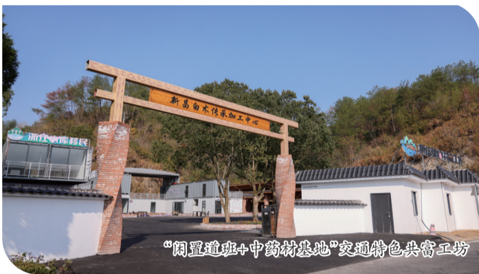
“闲置道班+中药材基地”交通特色共富工坊

近年来,县交通运输局深入贯彻落实习近平总书记关于“四好农村路”的重要指示精神,坚持“修一条路、造一片景、富一方百姓”理念,以实干作风夯基础、以实绩导向促发展、以实惠成果惠民生,高质量推进“四好农村路”2.0版建设。2024年我县农村公路路面PQI优良中等率位列全省第21名、全市第一,提升16位。通过整合黄坛道班、棠村道班、新林驿站等闲置资源,打造“闲置道班+中药材基地、农副产品加工”“驿站+水库管理用房”等融合模式,建成交通特色“共富工坊”示范点3个,提供就业岗位170余个,带动低收入农户增收约160万元,增加村集体收入约280万元。