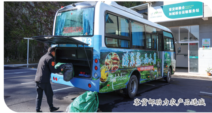
客货邮助力农产品进城

开通“公交送我去上班”专线,将就业半径延伸到周边村落,采取早接晚送方式,方便周边村民到工坊集群就业,跑完劳动力供需匹配“最后一公里”。目前,已开通“下岩贝·金山上”“溪山云荷”片区2条试点专线,辐射23个村,解决茶叶、小农生等产业劳动力缺口400余人。持续擦亮“新畅达”全国农村物流服务品牌,深化乡镇客货邮合作线路、智能交换箱设置与农村货源组织“三个全覆盖”,已累计开通合作线路29条,设置智能交换箱53个,提升改造农村物流服务站4个。同时,助力销售水蜜桃12万斤、西瓜8万斤、蔬菜3万斤,涉农总额100万元,惠及32户低收入家庭,带动村民增收。