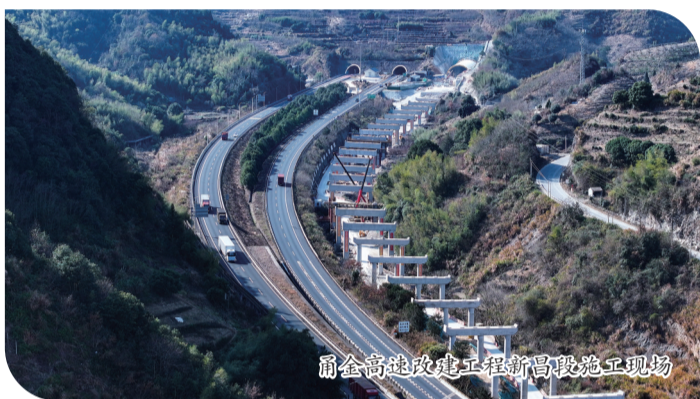
甬金高速改建工程新昌段施工现场

甬金高速公路改扩建工程新昌段,起点位于绍兴宁波交界处,经沙溪镇,终点设于新昌嵊州交界处成功岭隧道,采用双向八车道高速公路标准,设计时速由原来的局部80公里提升至100公里,其中沙溪互通至孙家田大桥为两侧拓宽,孙家田大桥至成功岭隧道段为单侧拓宽,往金华方向新增一处4车道的成功岭隧道,改造孙家田大桥一座,沙溪互通一处,全长5.72公里,总投资约12.23亿元。该项目于去年5月动工,孙家田分离桥梁结构、成功岭隧道进口、沙溪互通以及沙溪段高速主线等正在有序推进,截至目前已完成总体形象进度32%,预计2028年完工。