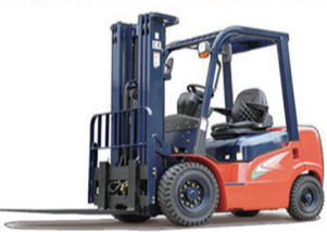
1.8-15.5T内燃叉车液力变速箱