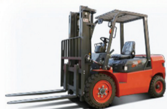
1.8-5T内燃叉车机械变速箱

站在新的发展起点,浙江中柴机器有限公司将继续以科技创新为引擎,以标准引领为抓手,深耕传动系统核心赛道,持续提升产业链供应链稳定性与竞争力,为我国制造业从“大而强”向“强而优”转型,铸就制造强国新辉煌贡献中柴力量。