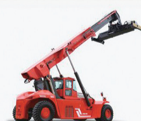
14T集装箱正面吊静压传动系统