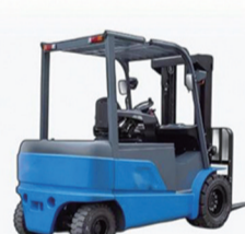
1.6-3.8T电动叉车一体式桥箱