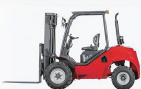
1.8-10T四驱越野叉车传动系统