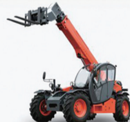
3.5-5T伸缩臂叉车传动系统