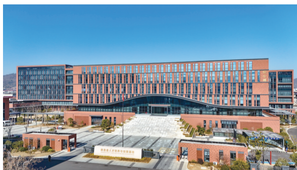
人才培养与创新基地