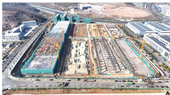
美力科技地块场平项目